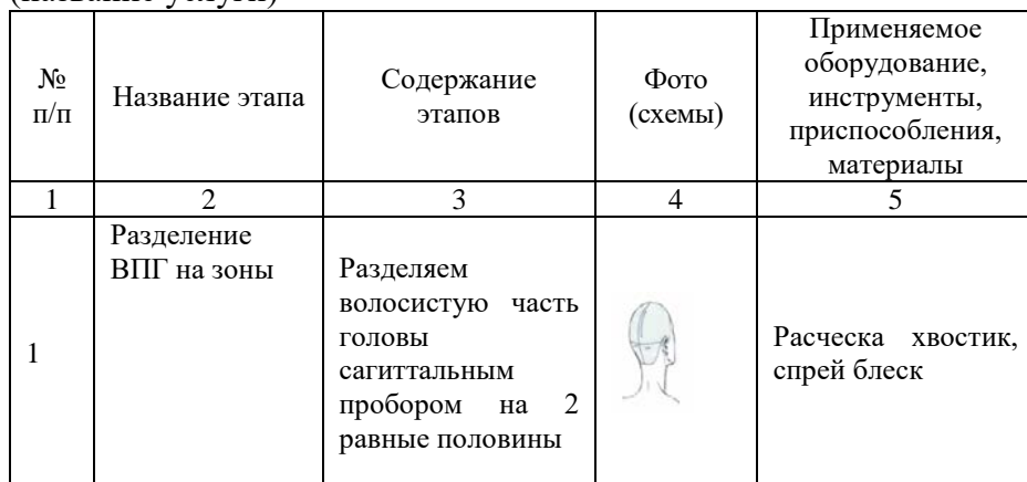
Таблица 6 - Инструкционно-технологическая карта (название услуги)

В таблицу включают графические схемы разработанной услуги. В конце главы приводят краткое описание заключительных работ.