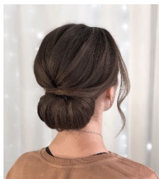
Рисунок 1 – Классическая собранная прическа

Аналогично оформляются и другие виды иллюстративного материала, такие как диаграмма, схема, график, фотография и т.д. Иллюстрация выполняется на одной странице.